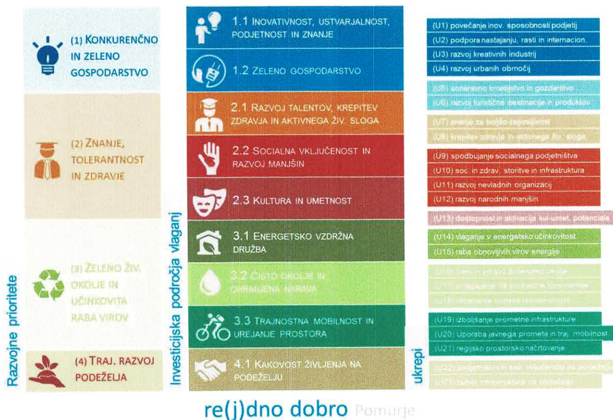
Slika 2: Prikaz prioritet, investicijskih področij in ukrepov RRP 2014-2020

Pomurje bo svojo razvojno vizijo in zastavljene strateške cilje uresničevalo v okviru štirih (4) razvojnih prioritet, devet (9) investicijskih področij in triindvajset (23) ukrepov .