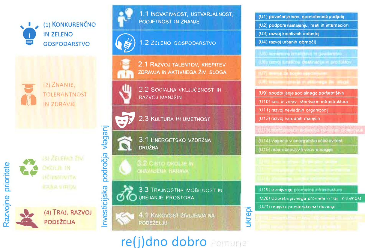
Slika 2: Prikaz prioritet, investicijskih področij in ukrepov RRP 2014-2020

Pomurje bo svojo razvojno vizijo in zastavljene strateške cilje uresničevalo v okviru štirih (4) razvojnih prioritet, devet (9) investicijskih področij in triindvajset (23) ukrepov .