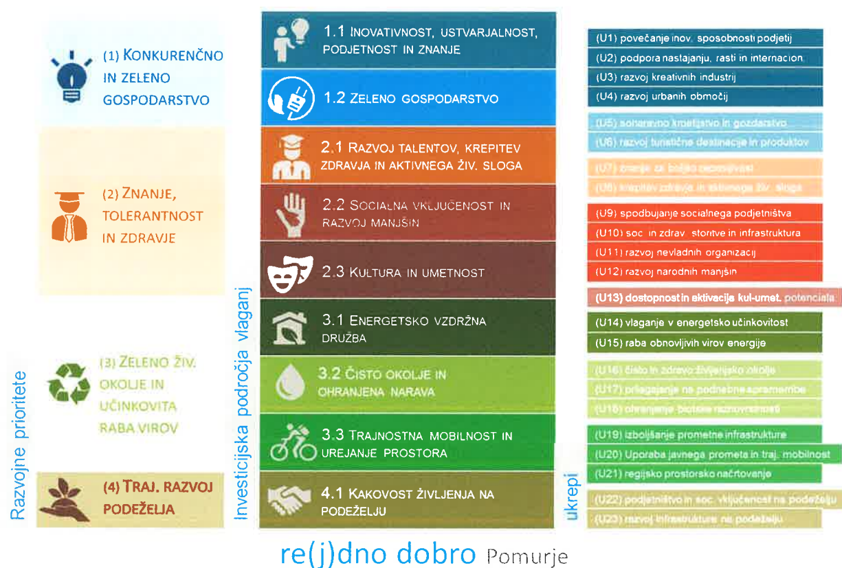
Slika 2: Prikaz prioritet, investicijskih področij in ukrepov RRP 2014-2020

Pomurje bo svojo razvojno vizijo in zastavljene strateške cilje uresničevalo v okviru štirih (4) razvojnih prioritet, devet (9) investicijskih področij in triindvajset (23) ukrepov .