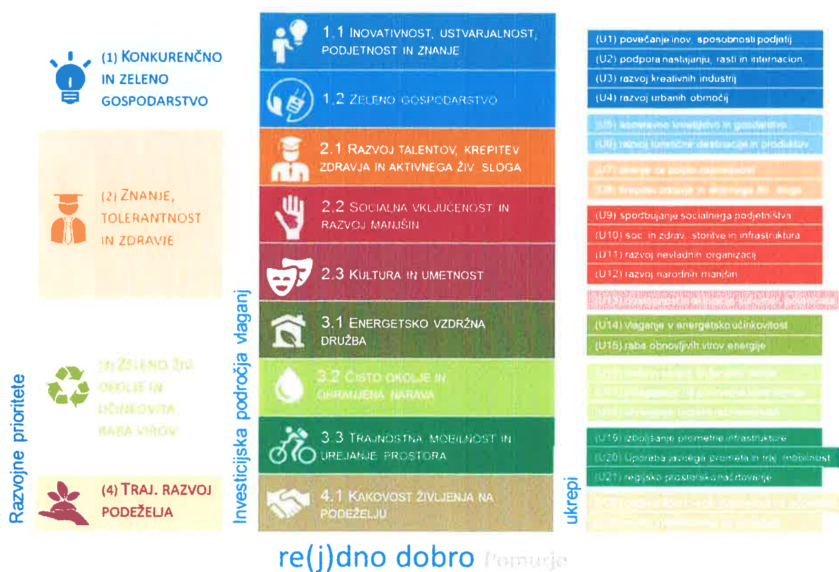
Slika 2: Prikaz prioritet, investicijskih področij in ukrepov RRP 2014-2020

Pomurje bo svojo razvojno vizijo in zastavljene strateške cilje uresničevalo v okviru štirih (4) razvojnih prioritet, devet (9) investicijskih področij in triindvajset (23) ukrepov.