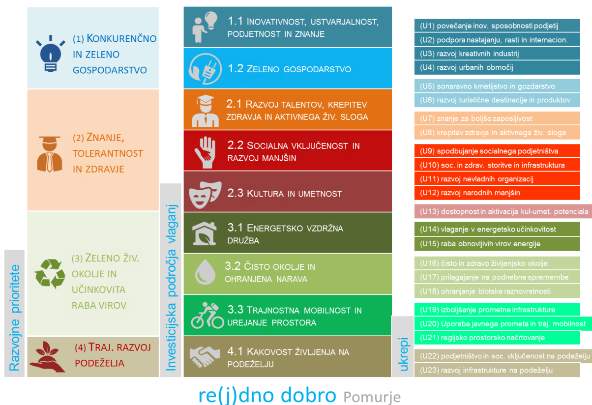
Slika 2: Prikaz prioritet, investicijskih področij in ukrepov RRP 2014-2020

Pomurje bo svojo razvojno vizijo in zastavljene strateške cilje uresničevalo v okviru štirih (4) razvojnih prioritet, devet (9) investicijskih področij in triindvajset (23) ukrepov.