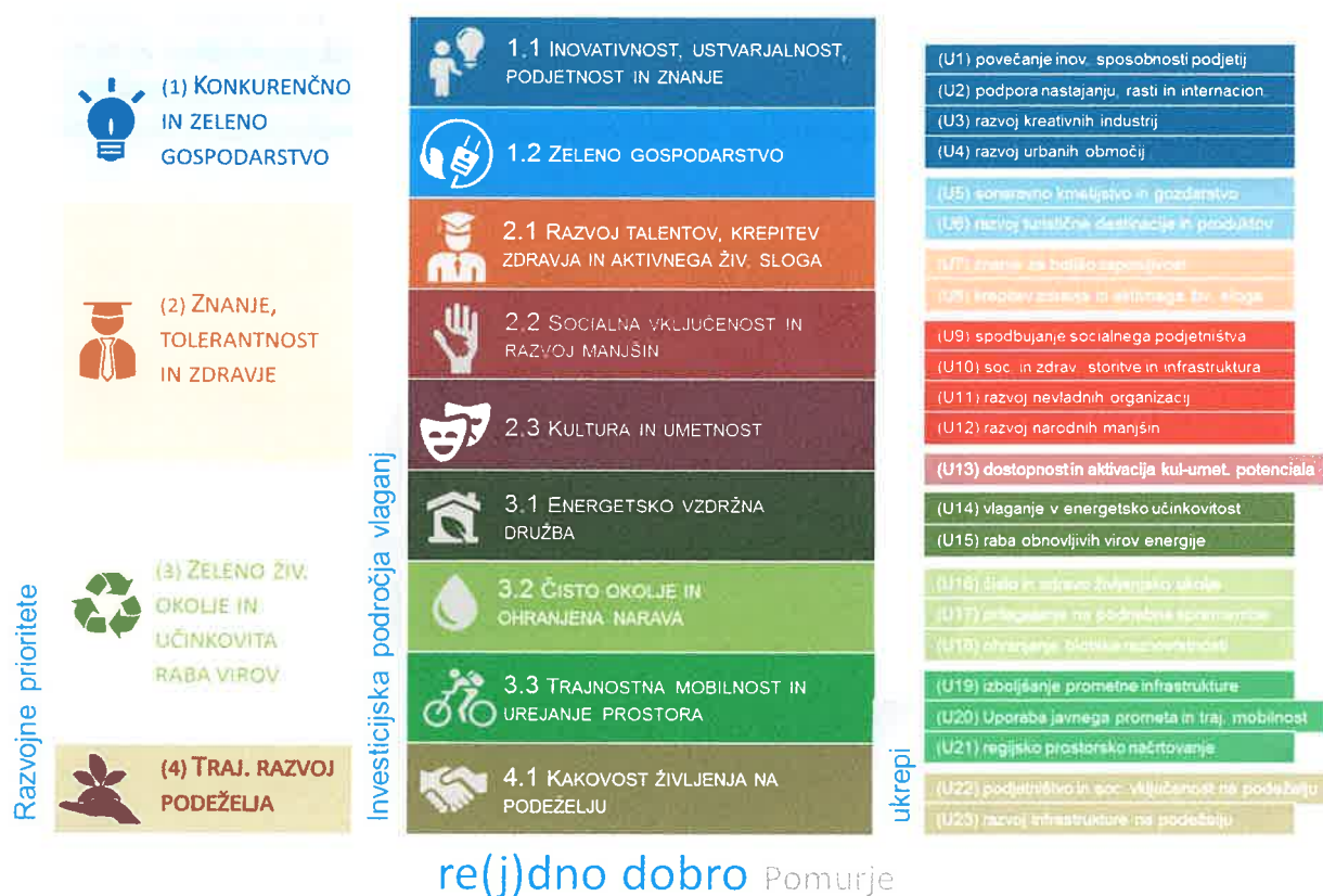
Slika 2: Prikaz prioritet, investicijskih področij in ukrepov RRP 2014-2020

Pomurje bo svojo razvojno vizijo in zastavljene strateške cilje uresničevalo v okviru štirih (4) razvojnih prioritet, devet (9) investicijskih področij in triindvajset (23) ukrepov.