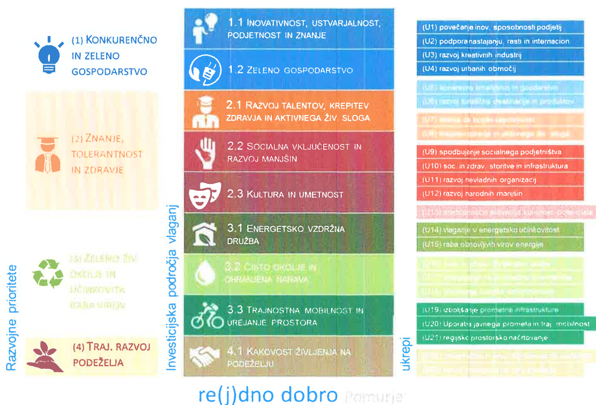
Slika 2: Prikaz prioritet, investicijskih področij in ukrepov RRP 2014-2020

Pomurje bo svojo razvojno vizijo in zastavljene strateške cilje uresničevalo v okviru štirih (4) razvojnih prioritet, devet (9) investicijskih področij in triindvajset (23) ukrepov .