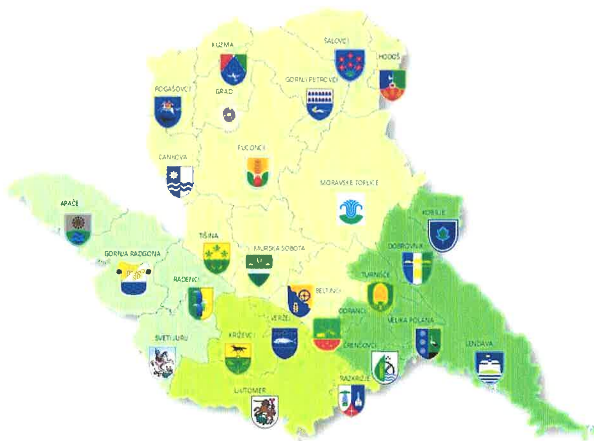
Slika 1: Območje priprave RRP 2021-2027

Apače, Beltinci, Cankova, Črenšovci, Dobrovnik, Gornja Radgona, Gornji Petrovci, Grad, Hodoš, Kobilje, Križevci, Kuzma, Lendava, Ljutomer, Moravske Toplice, Murska Sobota, Odranci, Puconci, Radenci, Razkrižje, Rogašovci, Sveti Jurij ob Ščavnici, Šalovci, Tišina, Turnišče, Velika Polana in Veržej.