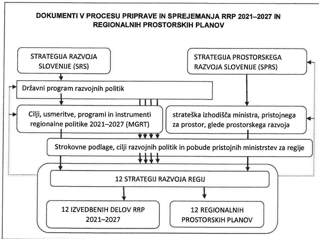
Slika 2: Dokumenti v procesu priprave in sprejemanja RRP 2021-2027 in regionalnih prostorskih planov.

MGRT, Direktorat za regionalni razvoj, Sektor za načrtovanje regionalnega razvoja , pripravi in medresorsko uskladi Program priprave RRP 2021–2027, pripravi predloge zakonodajnih podlag za pripravo RRP 2021–2027, pripravi cilje, usmeritve, programe in instrumente regionalne politike 2021–2027, pripravi poziv RRA za začetek postopka priprave RRP 2021–2027, pripravi navodila in strokovne podlage, obvešča o projektu prek spletne strani MGRT, pripravlja in javno objavlja odgovore na vprašanja deležnikov in vodi teritorialni razvojni dialog.