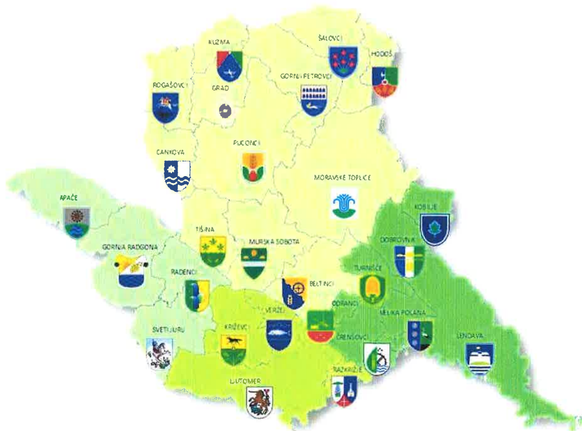
Slika 1: Območje priprave RRP 2021-2027

Apače, Beltinci, Cankova, Črenšovci, Dobrovnik, Gornja Radgona, Gornji Petrovci, Grad, Hodoš, Kobilje, Križevci, Kuzma, Lendava, Ljutomer, Moravske Toplice, Murska Sobota, Odranci, Puconci, Radenci, Razkrižje, Rogašovci, Sveti Jurij ob Ščavnici, Šalovci, Tišina, Turnišče, Velika Polana in Veržej.